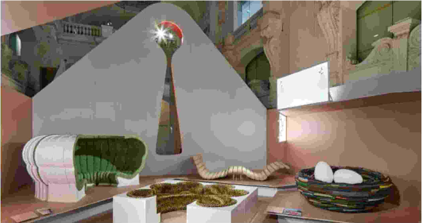
Al Louvre Per la a mostra "Private lives: from the bedroom to social media" sono stati usati 64 metri cubi di eco-pannelli