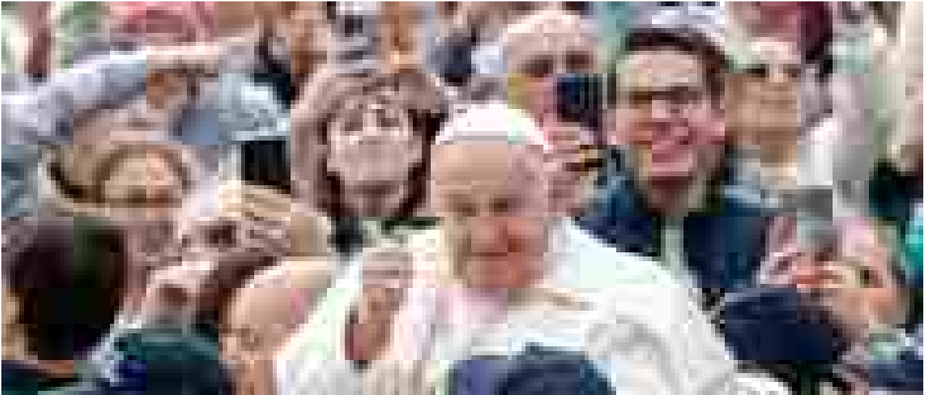
Il Papa, l'inclusione dei disabili sia una priorità in tutti i Paesi

Ritaglio stampa ad uso esclusivo del destinatario, non riproducibile.