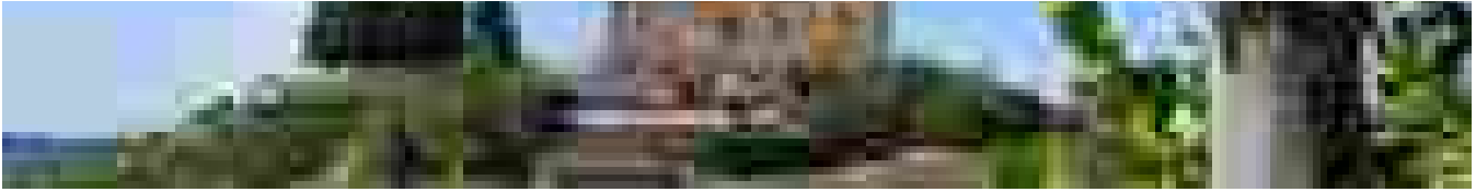
'Barolo en primeur', il 25 torna l'asta benefica internazionale