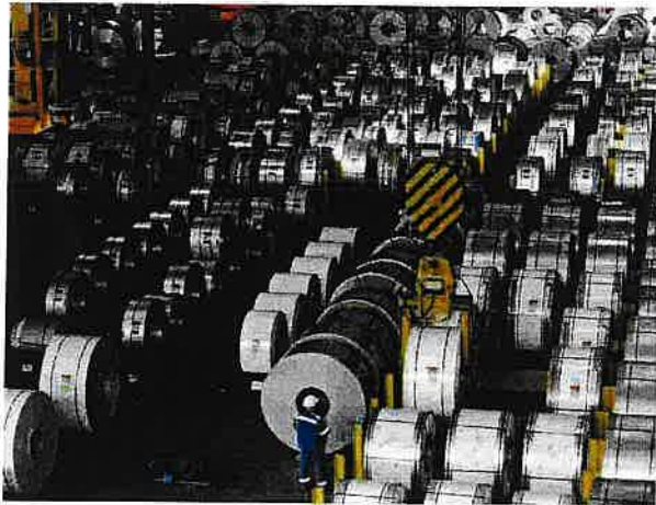
Le Top 20 mantovane appartengono per un quarto al settore metallurgico