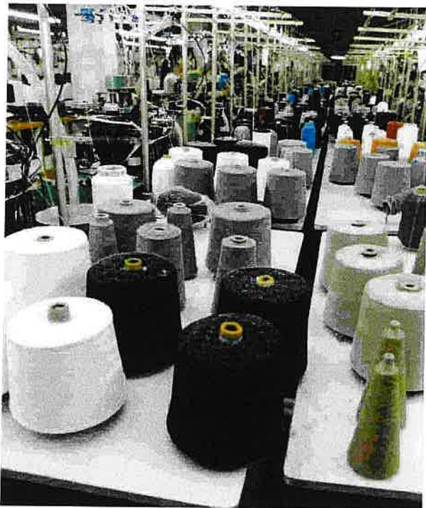
Una fabbrica per la produzione di filati